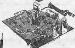
CONJUNTO BASICO Hemphill para 8 diferentes circuitos