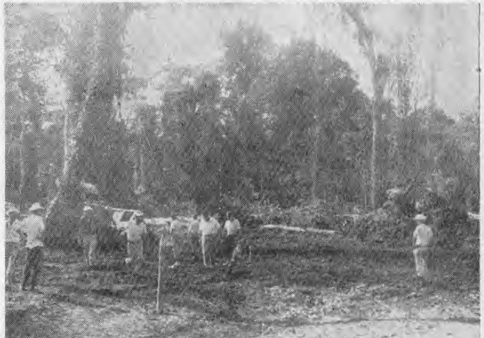
ITCO CUBRE TODO COSTA RICA — El último fin de semana un grup de funcionarios del Instituto de Tierras y Colonias, estuvieron en Cariari, inspeccionando las labores realizadas por los Colonos, instalados ahí. Acompañados de participantes en el Curso Agropecuario, patrocinado por el Banco Central y los nuevos propietarios de estas fértiles tierras, vieron la alta eficiencia de los tractores Caterpillar, que hicieron una excelente demostración talando una montaña.