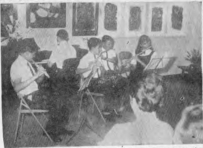
El Conservatorio Castella, cooperando con el programa de extensión cultural del Centro Cultural Costarricense Norteamericano, presentó un Festival de Poesía y Música el pasado martes 20 de setiembre.